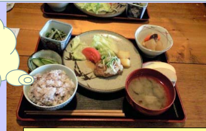
季節の野菜をいっぱい使った健康日替わりランチ