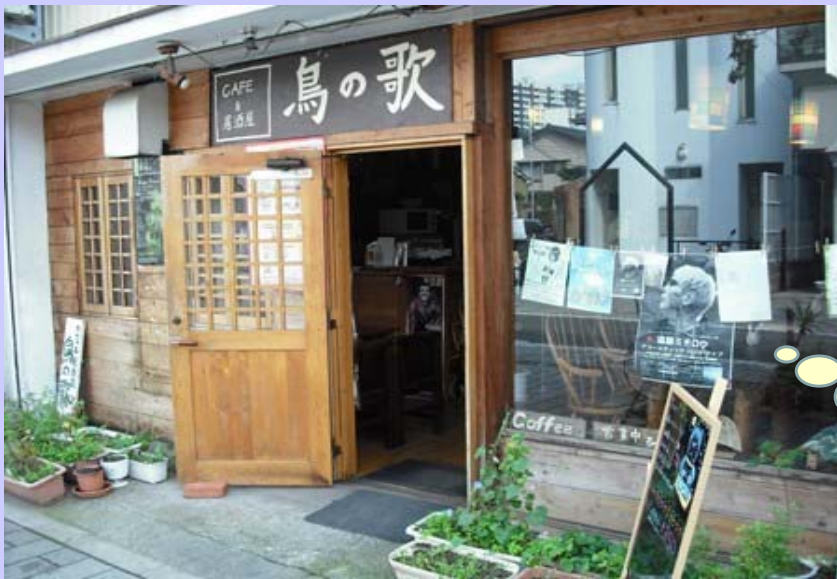
市中心部の白山神社に近く、静かな通りにある 小さなお店です。