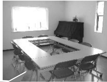
B室はピアノ があります♪

お茶を飲み語らう「地域のお茶の間」「しゃべり場」や情報交換・交流・くつろぎの場として、語学教室や塾、講演会、歌や練習会場、鑑賞会、ミニ・コンサート、発表会、会議室、展示会、サークル活動の拠点等々…ご自由にご活用ください。